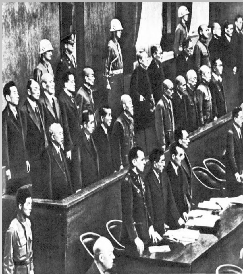
Токийский Международный трибунал для Дальнего Востока. Скамья подсудимых. Впереди — адвокаты