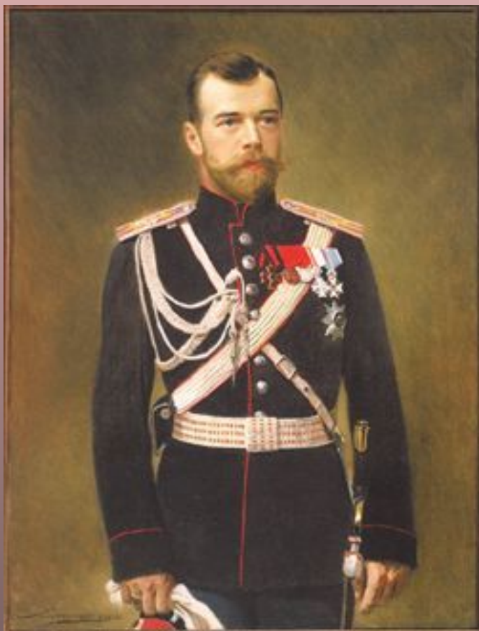
Дмитрий Анатольевич Медведев