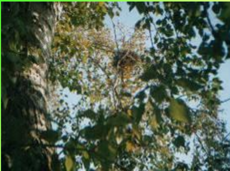
Гнездо цапли на берегу реки Иматка 2006