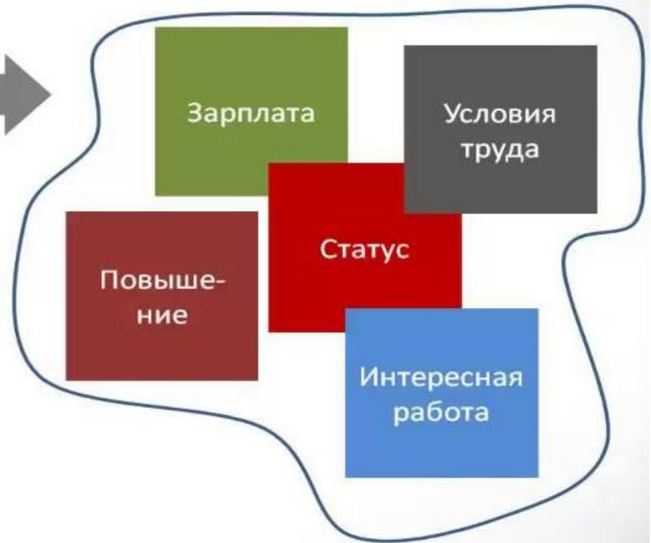
Возможная отдача за усердие (по мнению работника)