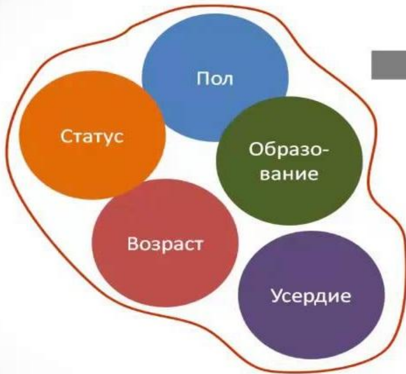
Факторы вклада в работу (по мнению работника)