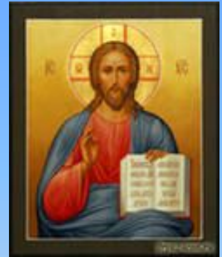
Икона Иисуса Христа