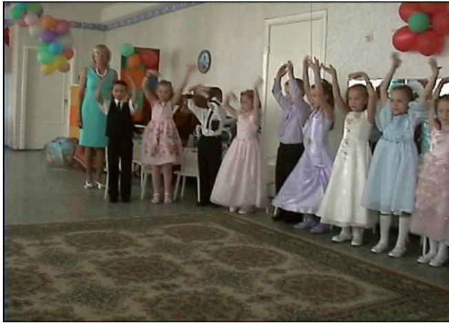
Танец «Это мы- дети».