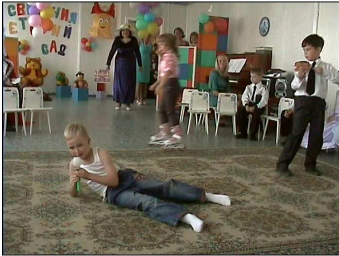
Дима Билан «Believe me»