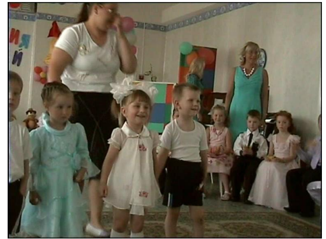
Малыши пришли к нам в гости.

Нарядился детский сад Не узнаешь прямо. Самый лучший свой наряд Надевает мама. И наглаженные брюки, Чисто вымытые руки, И волненья- просто нас Провожают в 1 класс!