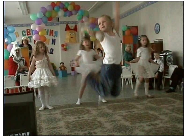
Дима Билан « Never let