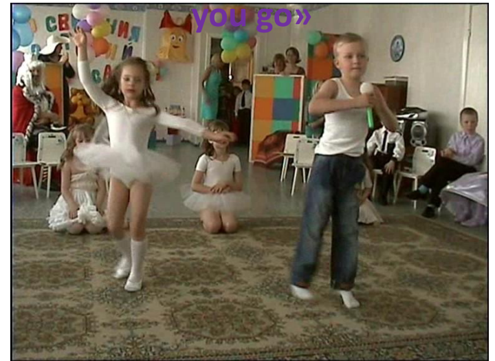
Дима Билан « Never let you go»