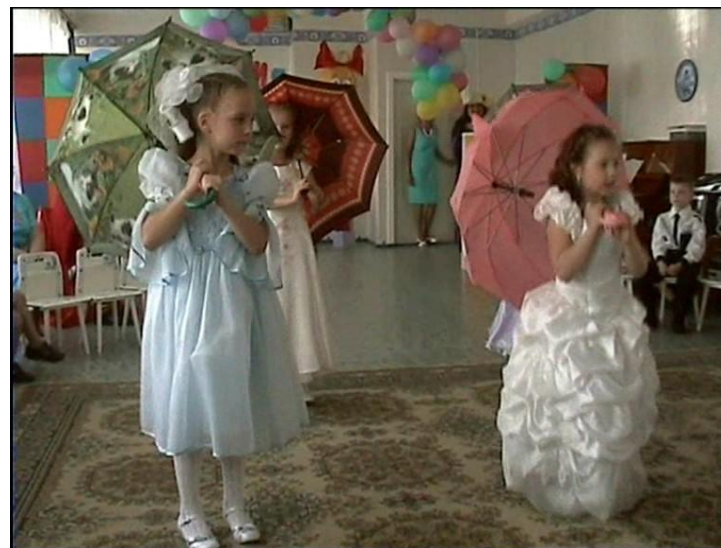
Попурри «Улетай туча».