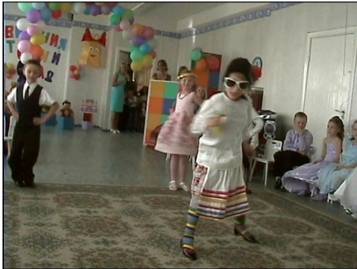
Верка Сердючка «Отдам любовь»