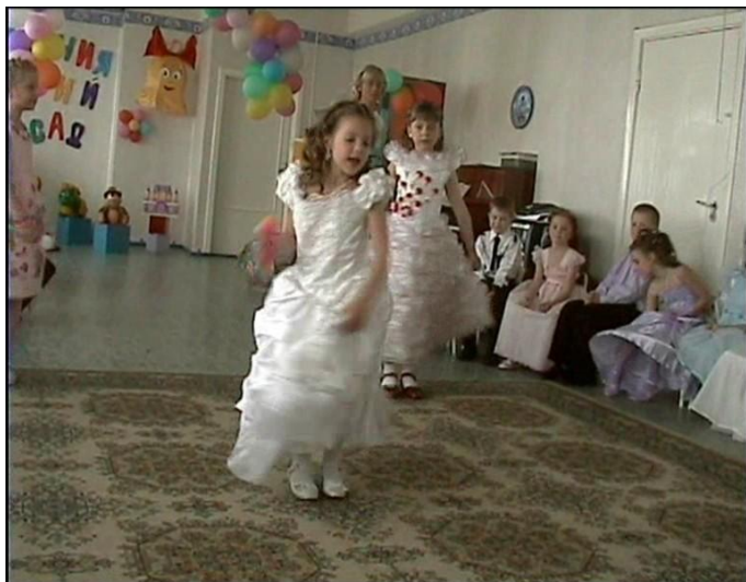
Танец «Лимонадный ДОЖДИК».