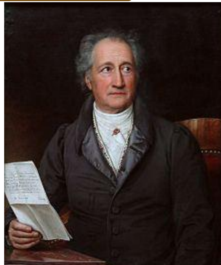
Иоганн Готфрид Гердер Иоганн Вольфганг фон Гёте