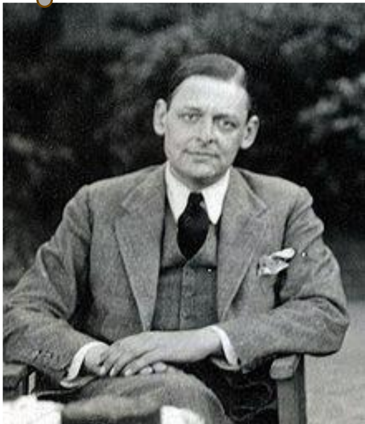
Элиот, Томас Стернз