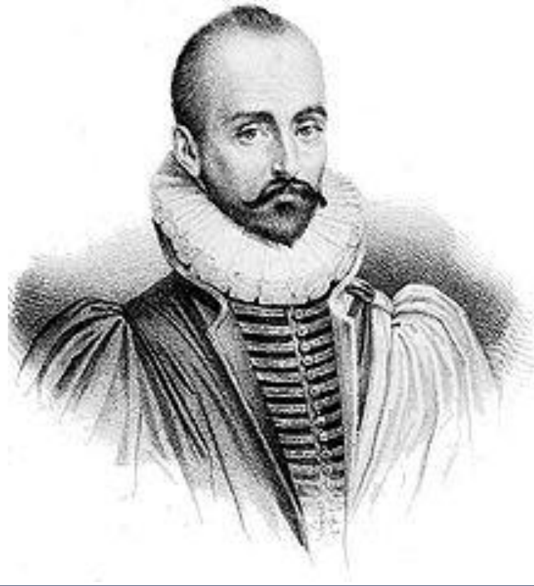
Мишель де Монтень