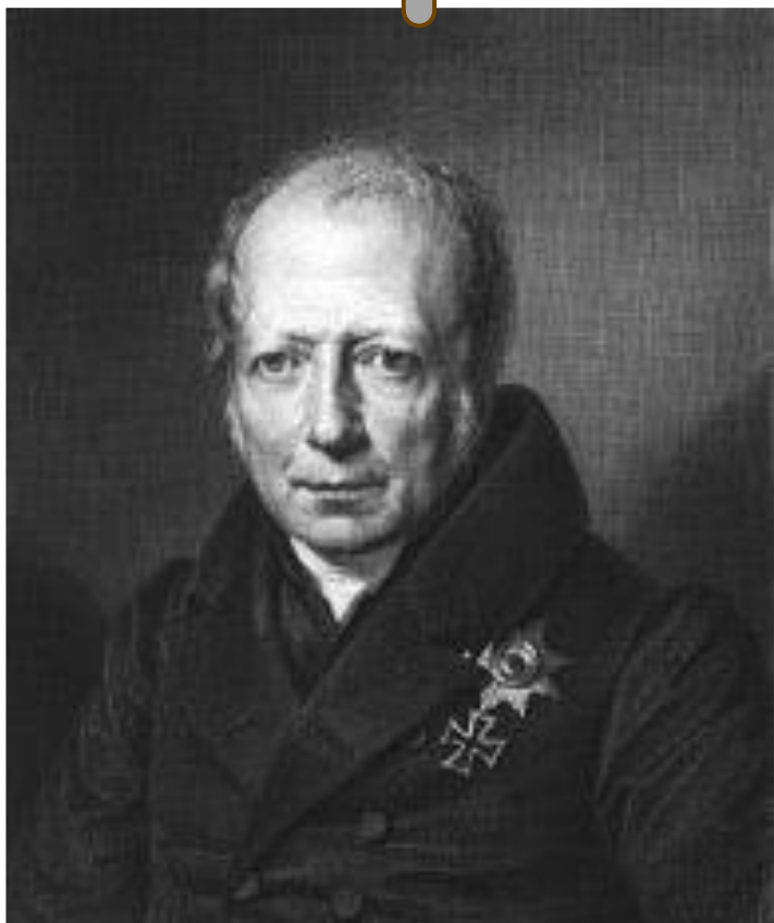
Вильгельм фон Гумбольдт