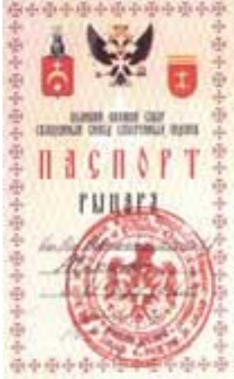
Старинный Мальтиский паспорт