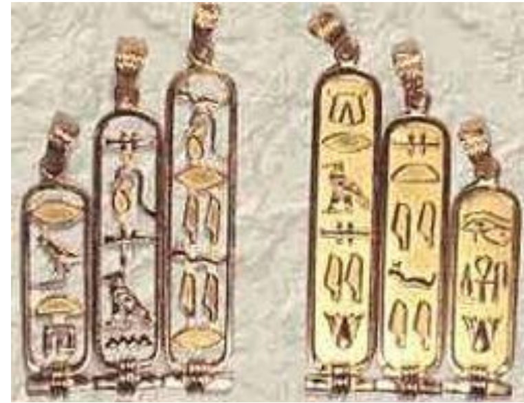
Картуш – паспорт древних владык в Египте