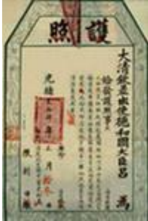
Китайский паспорт династии Цинь 1898 г