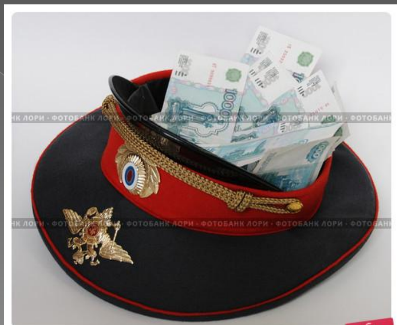
Деньги в фуражке