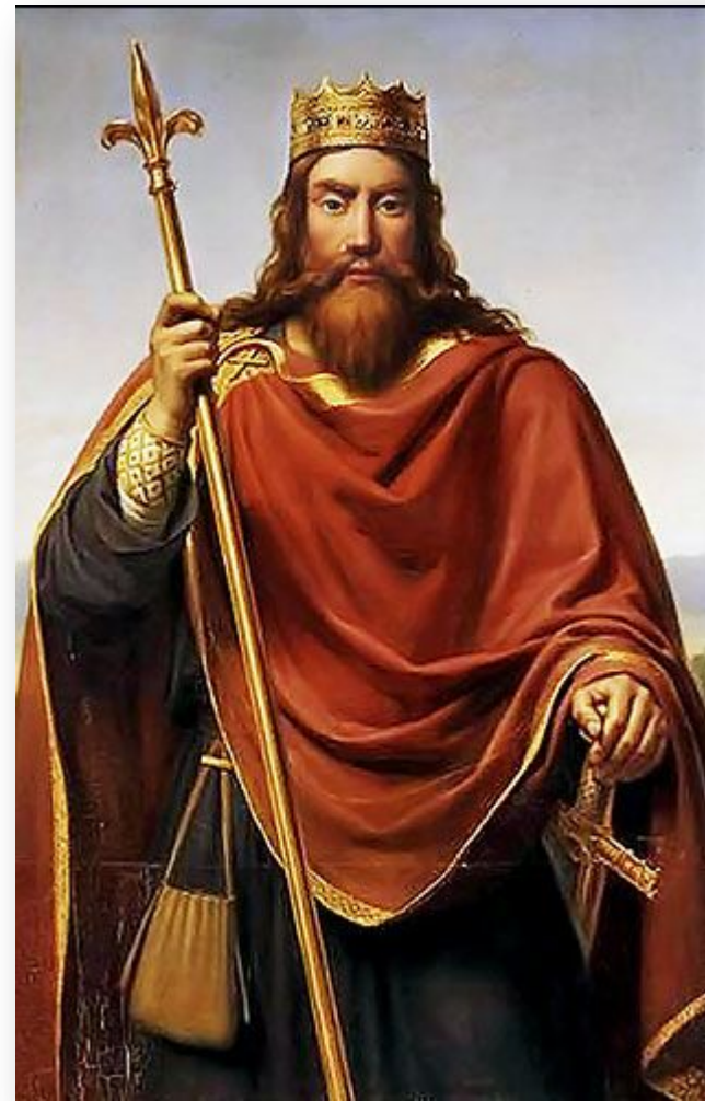
Византийский император Анастасий прислал Хлодвигу пурпурную мантию и диадему – знаки императорской власти