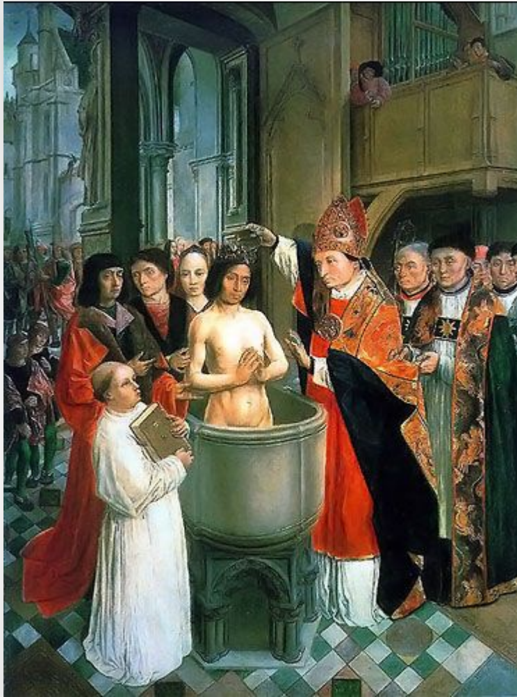
Крещение Хлодвига (около 498 г.)