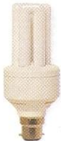
С байонетным цоколем