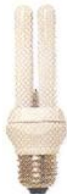
С резь- бовым цоколем