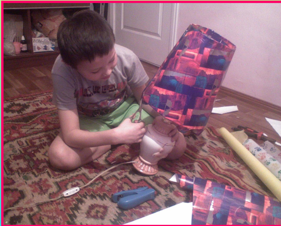
Натягивание бумаги на каркас