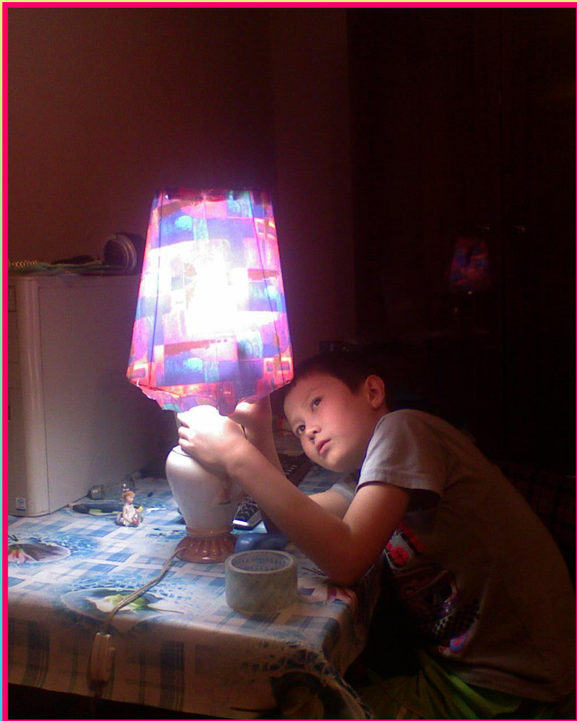
Проверка устойчивости абажура