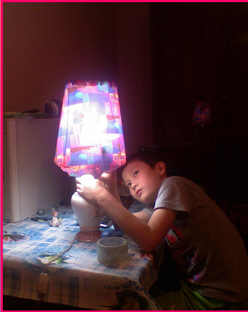
Проверка устойчивости абажура