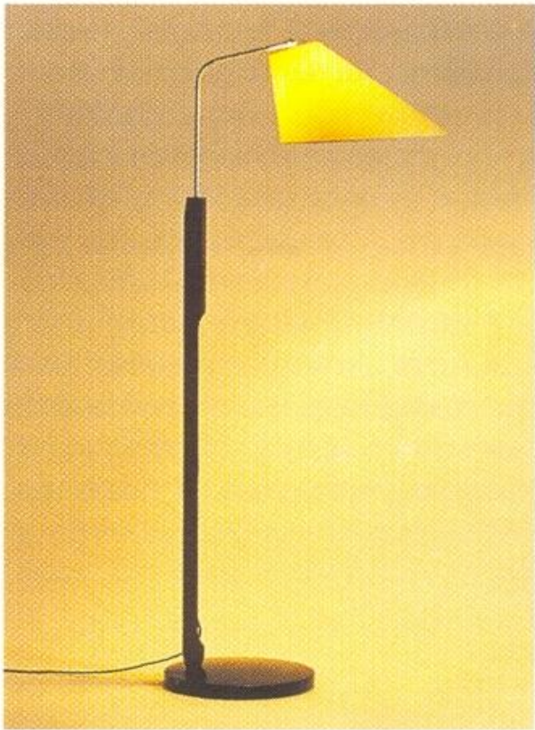
Бронзовый торшер с бумажным абажуром

Помимо общего освещения нужны лампы для чтения: они должны быть достаточно яркими, но свет давать направленный, поэтому абажуры у таких ламп не бывают прозрачными.