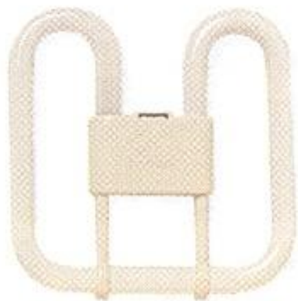
Миниатюрная плоская лампа