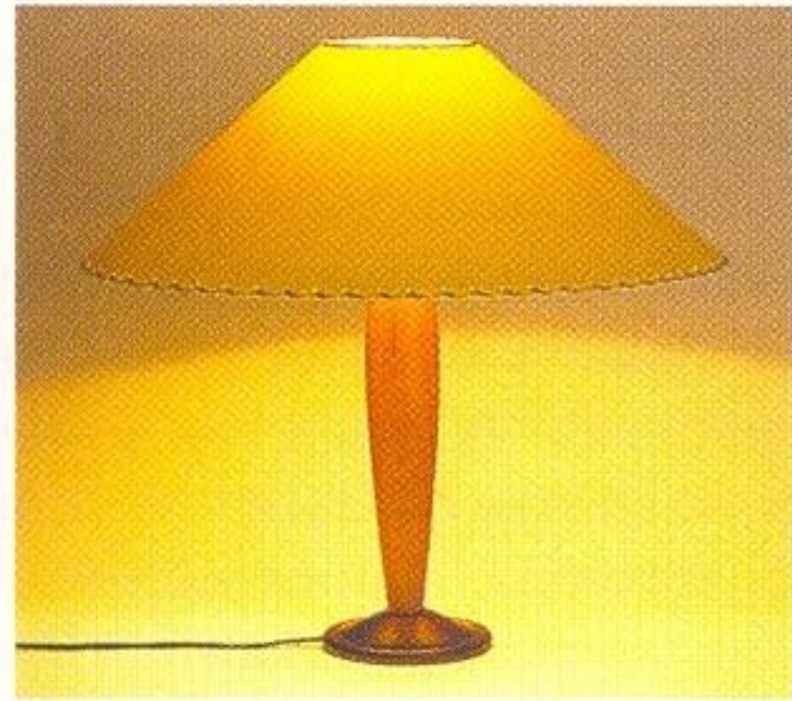
Деревянная подставка и бумажный абажур