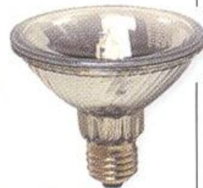
Рефлектор на 220 В