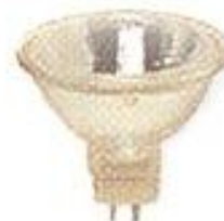
Миниатюр- ный низко- вольтный рефлектор