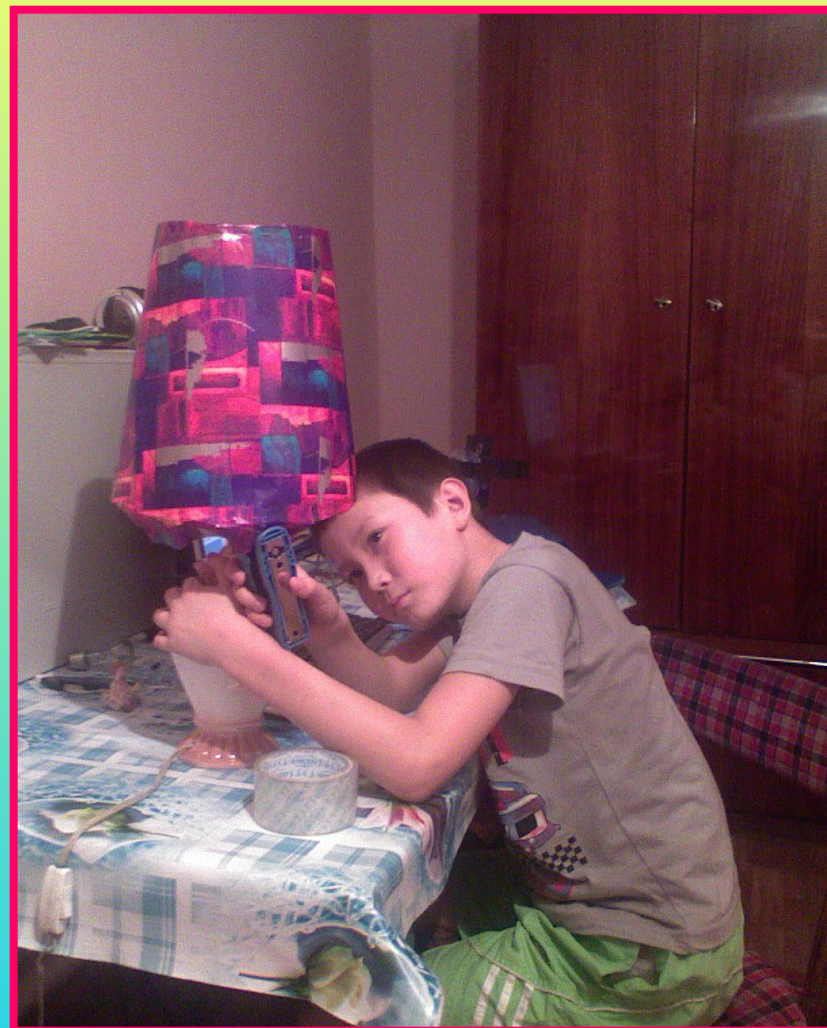
Закрепление скобами и обрезка