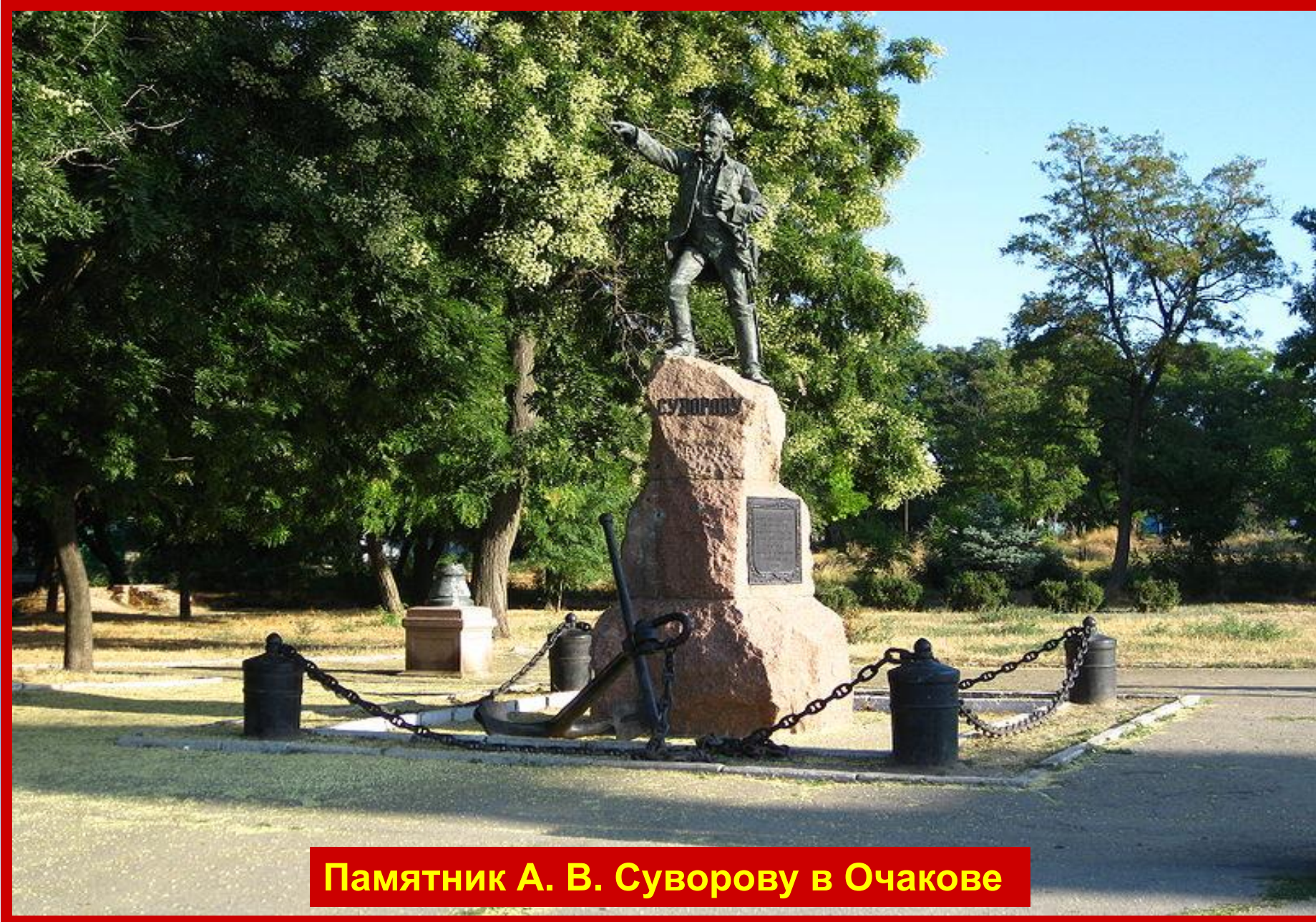
Памятник А. В. Суворову в Очакове