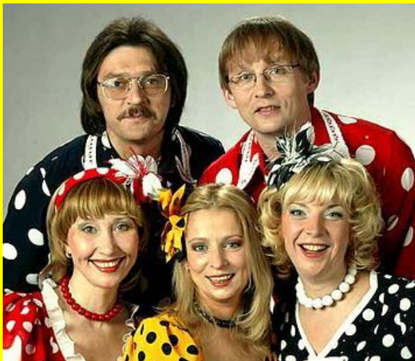
Группа Группа "Группа Чё те надо Гру ппа "Чё те надо" "Балаган