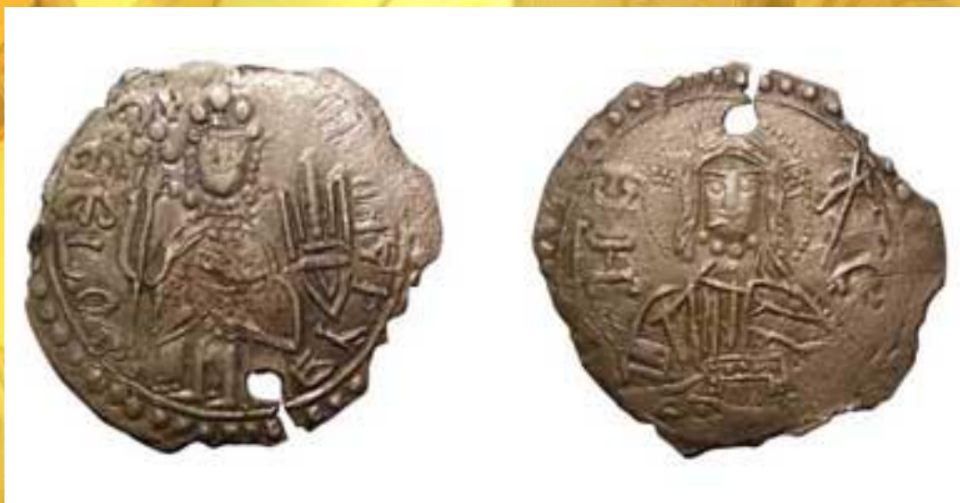
Монета Киевской Руси