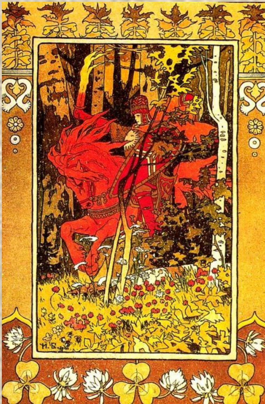
Красный всадник. Иллюстрация к сказке «Василиса Прекрасная»