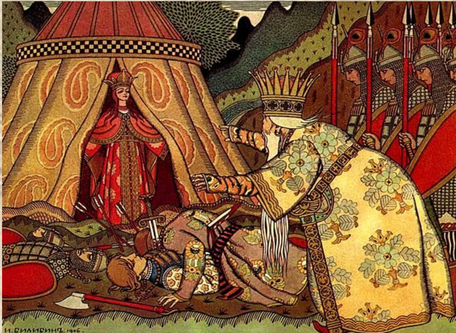
Иллюстрация к «Сказке о Золотом петушке»