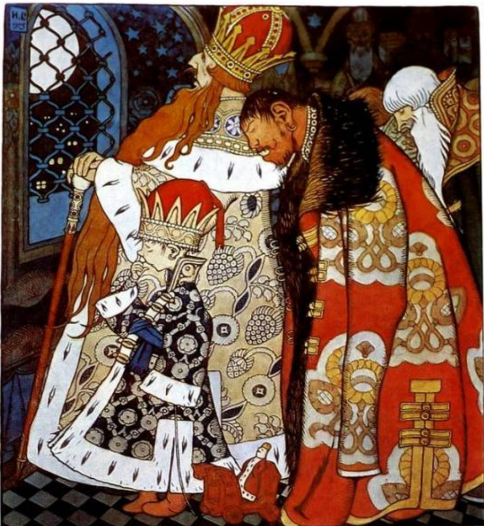
Царь Горох. Обложка журнала «Жупел»

Единакуд Великий и Преславный Царь Горох и сынома своего, сла- виль и могучий богатырь, преславный Князь Горохолом Горохо- вичем и со мнѣнами близкими бояры, возстава отъ богатства и сильныя прашези, ведуволное чрего свое заморскими яствами прекрасныя, пахощедекъ оконцу, урѣла мѣсяцѣ летели воходящя, и испусти Царь Горохъ вздохъ отъ нѣдръ утробы своея в вопросы единаго отъ ближнихъ бояръ своихъ: кто смѣ азъ, корюжа ми? онъ же рече ему: Ты еси великий и преславный Царь Горохъ, властелинъ надъ всю Землю! и паки улѣваи взаетъ свой Царь Горохъ на себѣ: Тема мѣсяцъ и Тако премелкшии соизволил: а плазю кто царюветъ?