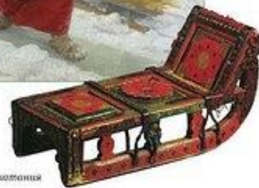
Сани для катания