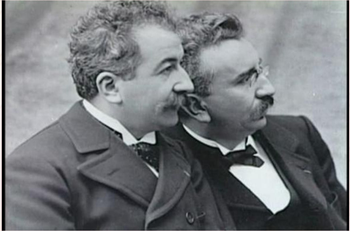
Огюст и Луи Люмьер