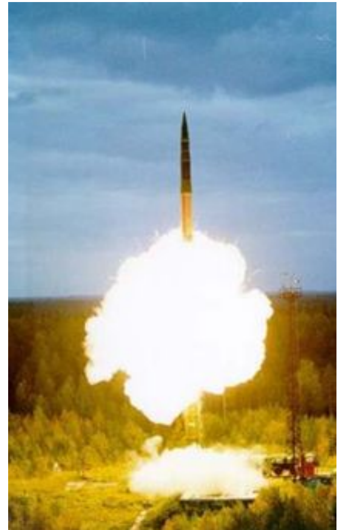
Тактико-технические характеристики ракеты "Тополь М"