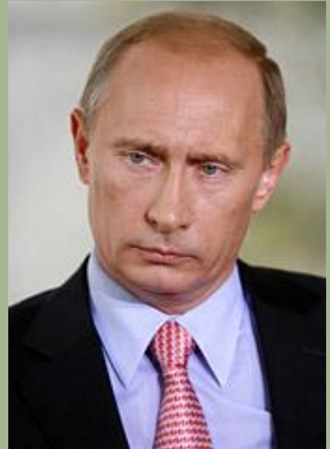
Путин Владимир Владимирович

Вооруженными Силами осуществляет Президент Российской Федерации, который в соответствии с Конституцией является Верховным Главнокомандующим Вооруженными Силами Российской Федерации.