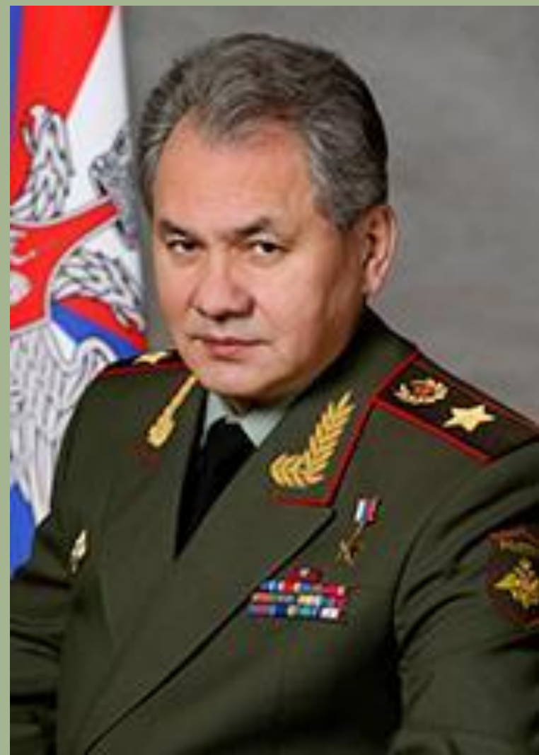
Шойгу Сергей Кужугетович

Управление Вооруженными Силами осуществляет министр обороны через Министерство обороны и Генеральные штаб Вооруженных Сил Российской Федерации