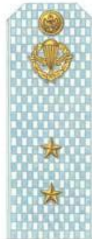
Прапорщик (парадная форма одежды, ВДВ)