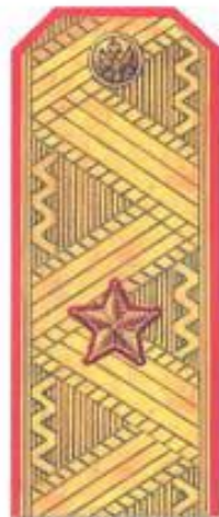
Генерал-майор (парадная форма одежды)