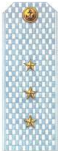
Старший мичман (парадная форма одежды, ВМФ)