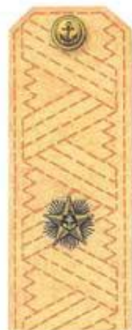
Контр-адмирал (повседневная форма одежды)