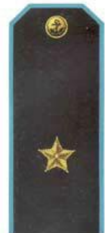
Генерал-майор (повседневная форма одежды, морская авиация)