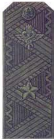
Генерал-майор (полевая форма одежды)