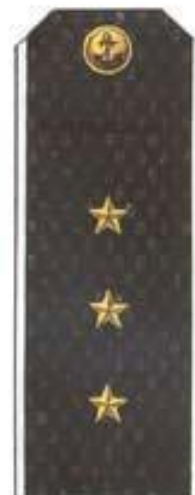
Старший мичман (повседневная форма одежды, ВМФ)