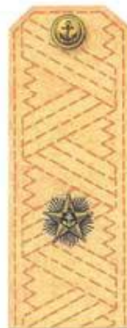
Контр-адмирал (повседневная форма одежды)