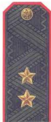
Генерал-лейтенант (повседневная форма одежды)