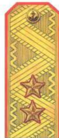
Генерал-лейтенант (парадная форма одежды, береговые войска)