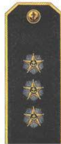
Адмирал (повседневная форма одежды)