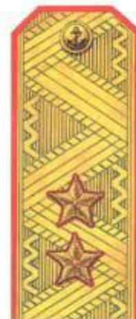
Генерал-лейтенант (парадная форма одежды, береговые войска)