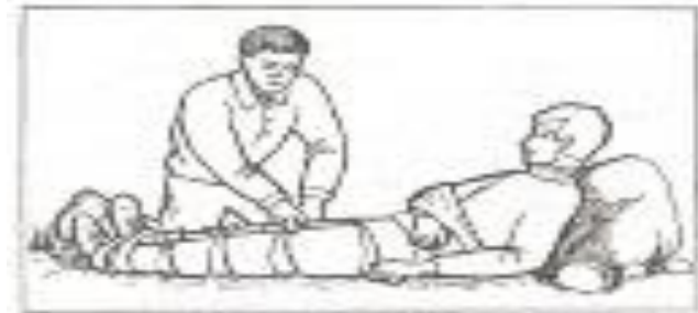
Если нет возможности вызвать врача, немедленно обратитесь в травмпункт или стационар.