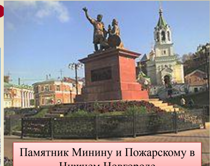
Памятник Минину и Пожарскому в Нижнем Новгороде