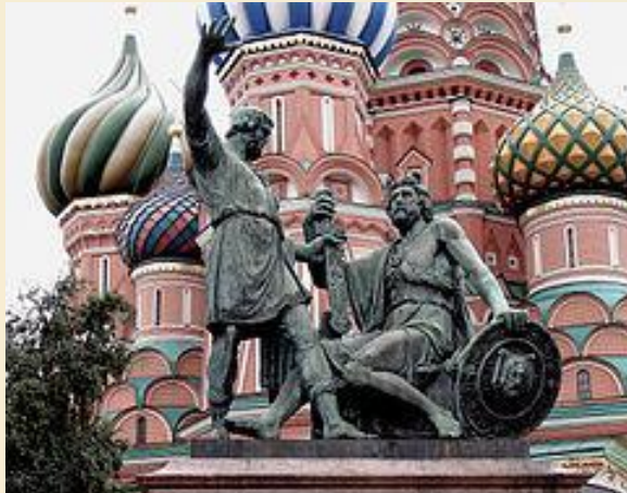
Памятник Минину и Пожарскому на Красной площади в Москве