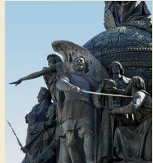
Дмитрий Пожарский на Памятнике «1000-летие России» в Великом Новгороде