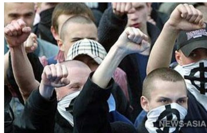
В Костроме скинхеды напали на неформалов