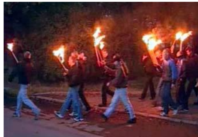
Скинхеды. Факельное шествие в Петербурге.