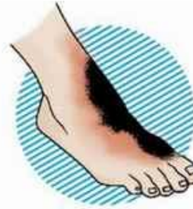
III–IV степень – обугливание кожи и тканей (до кости)