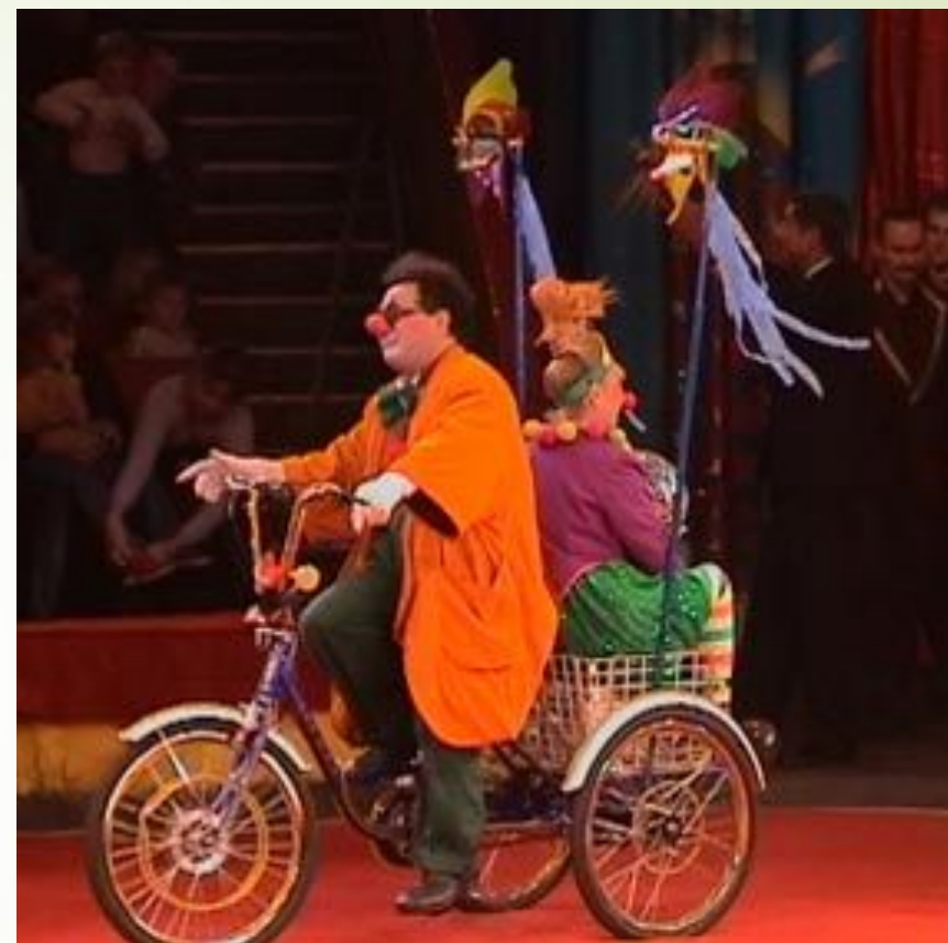
Клоуны в цирке разгонят тоску.