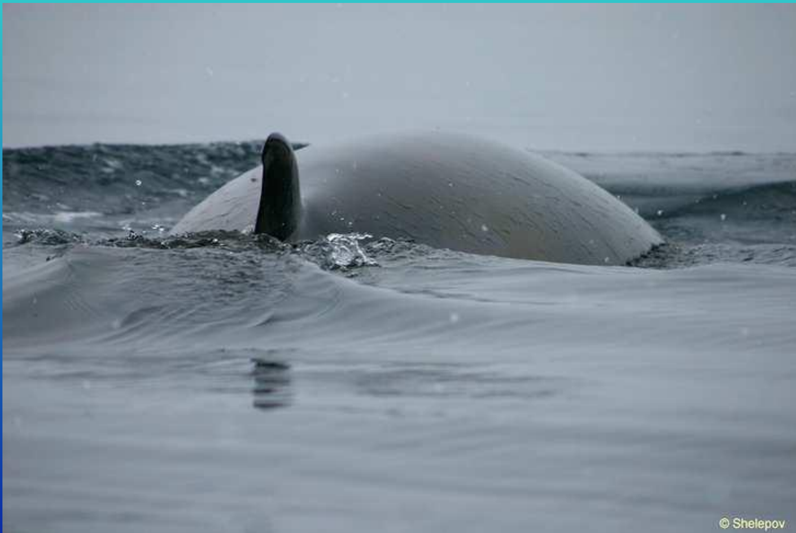
Кит малый полосатик