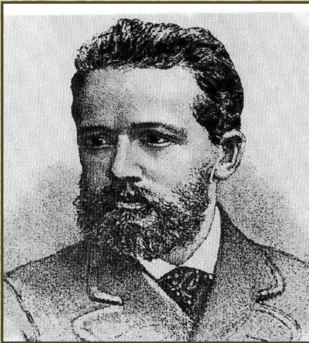
Пётр Ильич Чайковский 1840 – 1893 г.г.