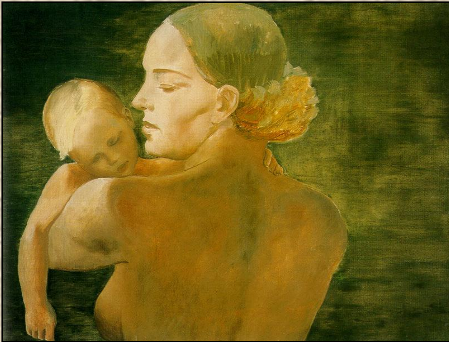
А. Дейнека « Мать »