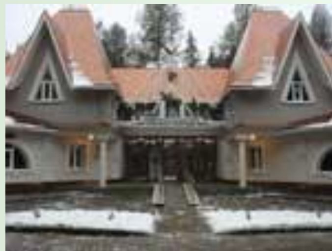
Филиал Московского зоопарка