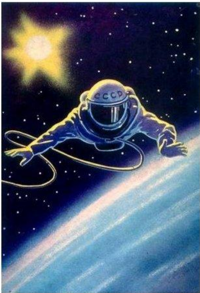
Человек над планетой