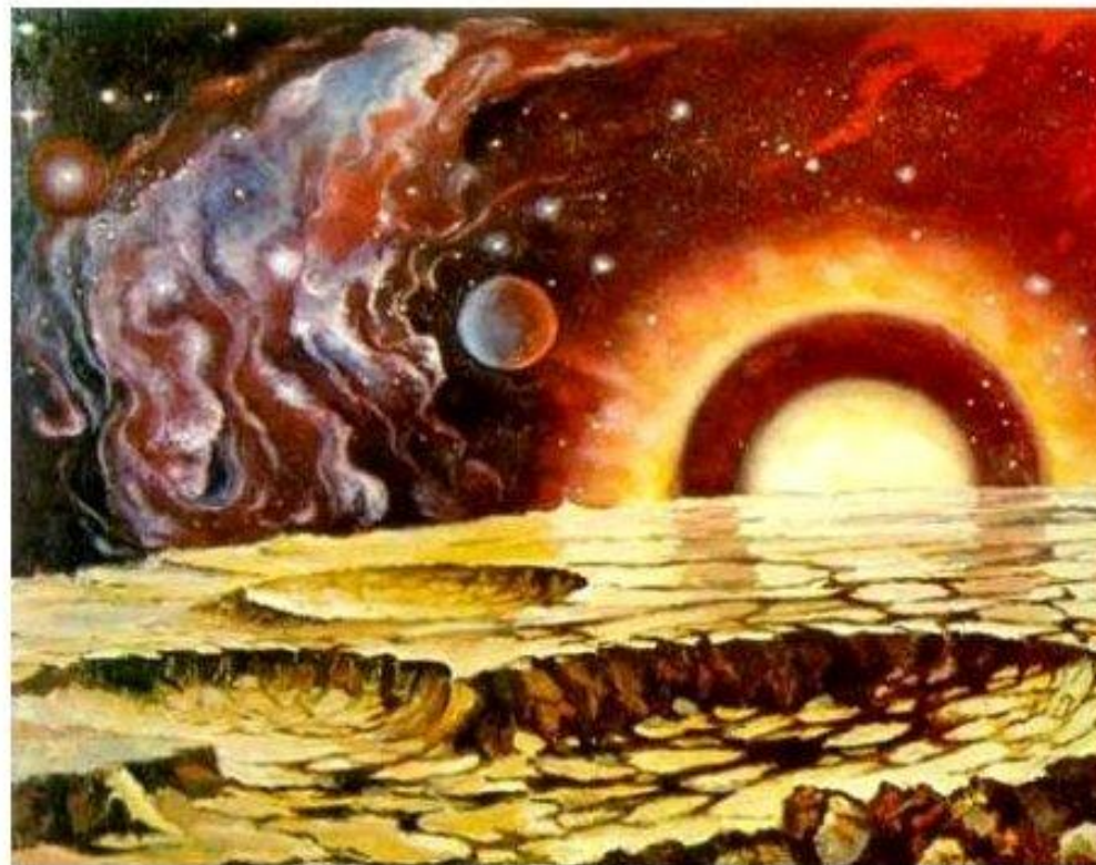
Планета в туманности IC443