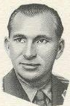
КОМАНДИР КОСМИЧЕСКОГО КОРАБЛЯ-СПУТНИКА „ВОСХОД-2“ ЛЕТЧИК-КОСМОНАВТ ПОЛКОВНИК ПАВЕЛ ИВАНОВИЧ БЕЛЯЕВ