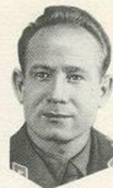
ВТОРОЙ ПИЛОТ КОСМИЧЕСКОГО КОРАБЛЯ-СПУТНИКА „ВОСХОД-2“ ЛЕТЧИК-КОСМОНАВТ ПОДПОЛКОВНИК АЛЕКСЕЙ АРХИПОВИЧ ЛЕОНОВ

46 лет назад с космодрома Байконур стартовала ракета-носитель "Союз", на борту которой был космический корабль " Восход-2 ". Его экипаж стоял из двух человек: командир корабля Павел Беляев и второй пилот Алексей Леонов . Весь полет продолжался немногим более суток, но это был исторический полет. Во время него - 18 марта 1965 года, летчик-космонавт Алексей Архипович Леонов первым из землян вышел за пределы космического корабля и совершил первый в истории выход человека в открытый космос.