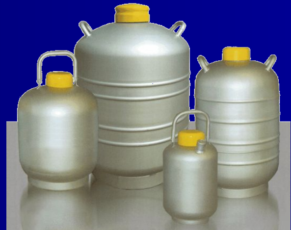
Дьюар - сосуды