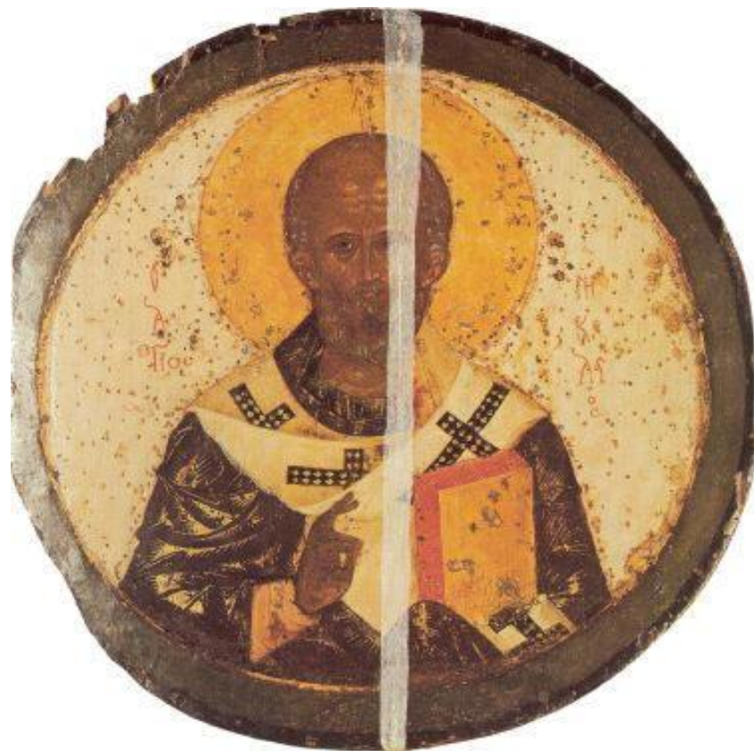
Святитель Николай, Новгород XII век