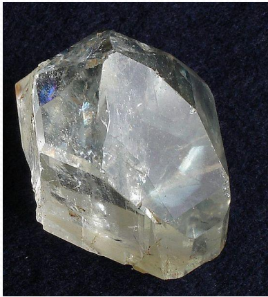
Бесцветный топаз, Минас- Жерайс, Бразилия

Месторождения - Россия (Урал), Украина ( Житомирская область), Бразилия, о. Мадагаскар.