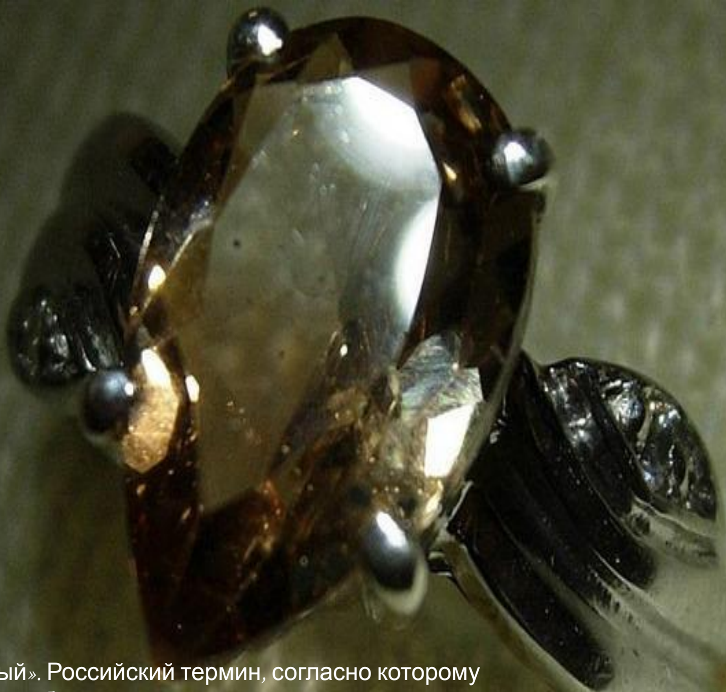
«Чайный». Российский термин, согласно которому называют бледно-желтую разновидность;