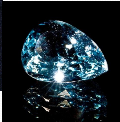
Граненый голубой топаз