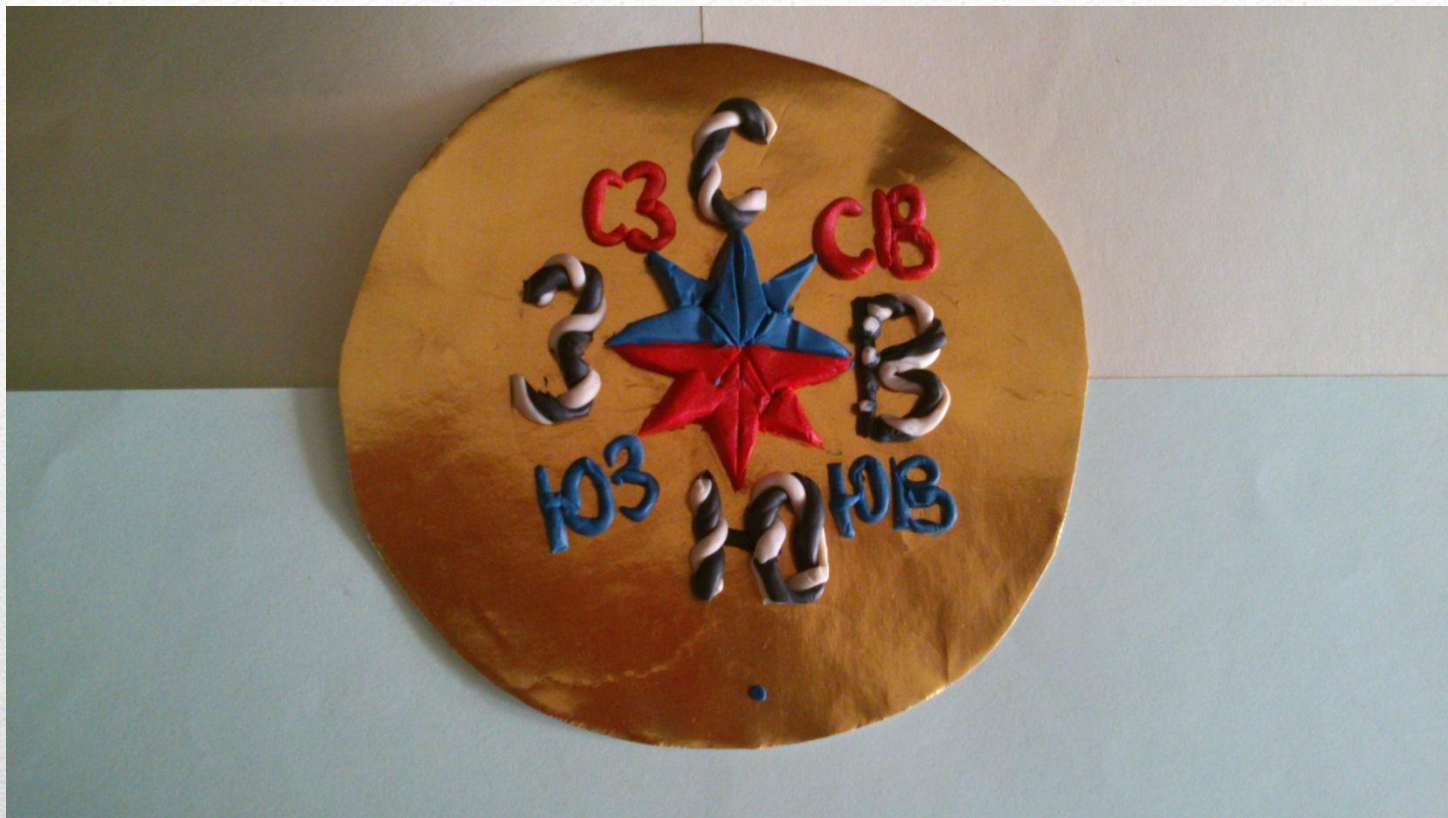
Модель «Стороны горизонта»