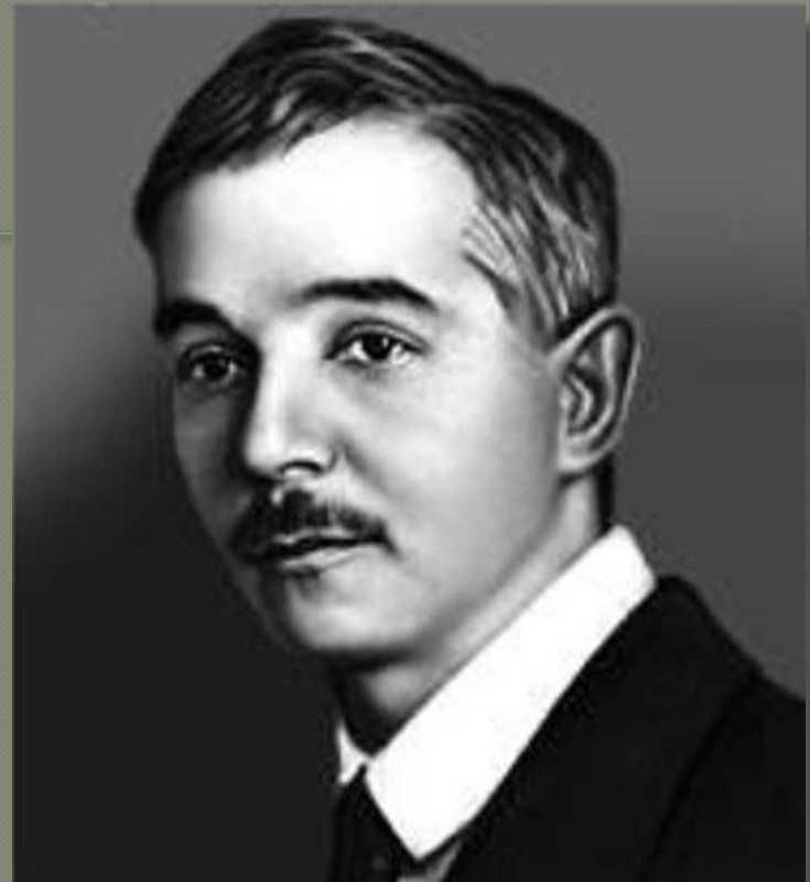
Александр Михайлович Гликберг 1880 - 1932

Родился 1 октября 1880 года в Одессе, в семье аптекаря. Учился в Житомирской гимназии. В 1905 году переехал в Петербург и стал сотрудничать в сатирических журналах. Первый сборник стихов «Разные мотивы» в 1906 году был задержан цензурой. Один год жил в Германии, где слушал лекции в одном из немецких университетов. В 1908-1911 годах активно сотрудничал в журнале «Сатирикон»