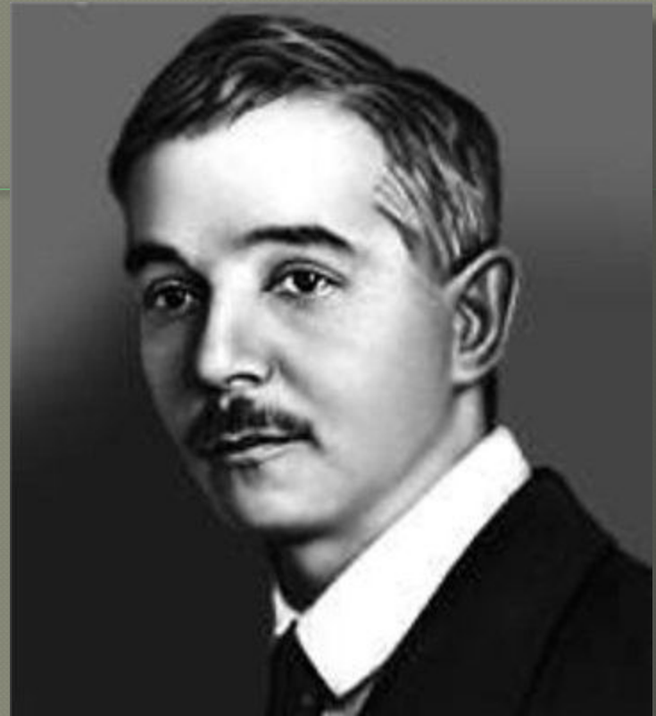
Александр Михайлович Гликберг 1880 - 1932

Родился 1 октября 1880 года в Одессе, в семье аптекаря. Учился в Житомирской гимназии. В 1905 году переехал в Петербург и стал сотрудничать в сатирических журналах. Первый сборник стихов «Разные мотивы» в 1906 году был задержан цензурой. Один год жил в Германии, где слушал лекции в одном из немецких университетов. В 1908-1911 годах активно сотрудничал в журнале «Сатирикон»