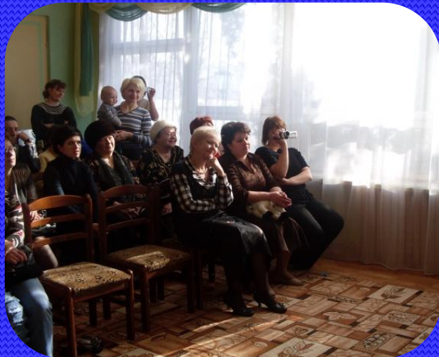
Общие родительские собрания