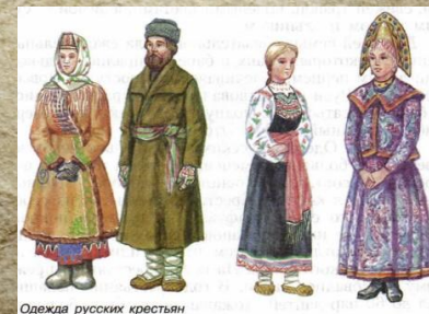
Одежда русских крестьян