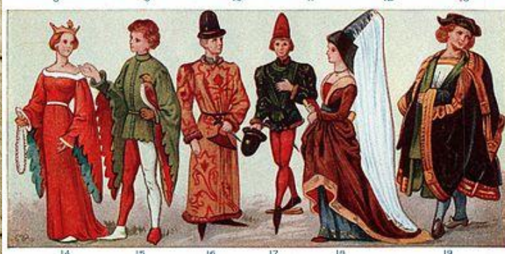
DRESS OF ANCIENT PERIOD (SEE DESCRIPTION FOLLOWING)