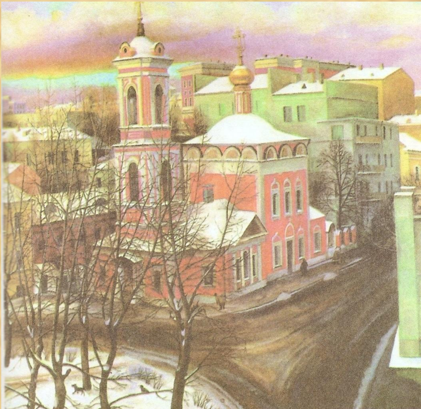
1988 год – год написания картины «Церковь Вознесения на улице Неждановой»