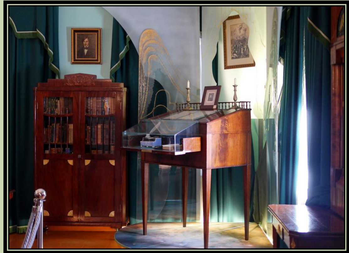
В кабинете Н.В. Гоголя