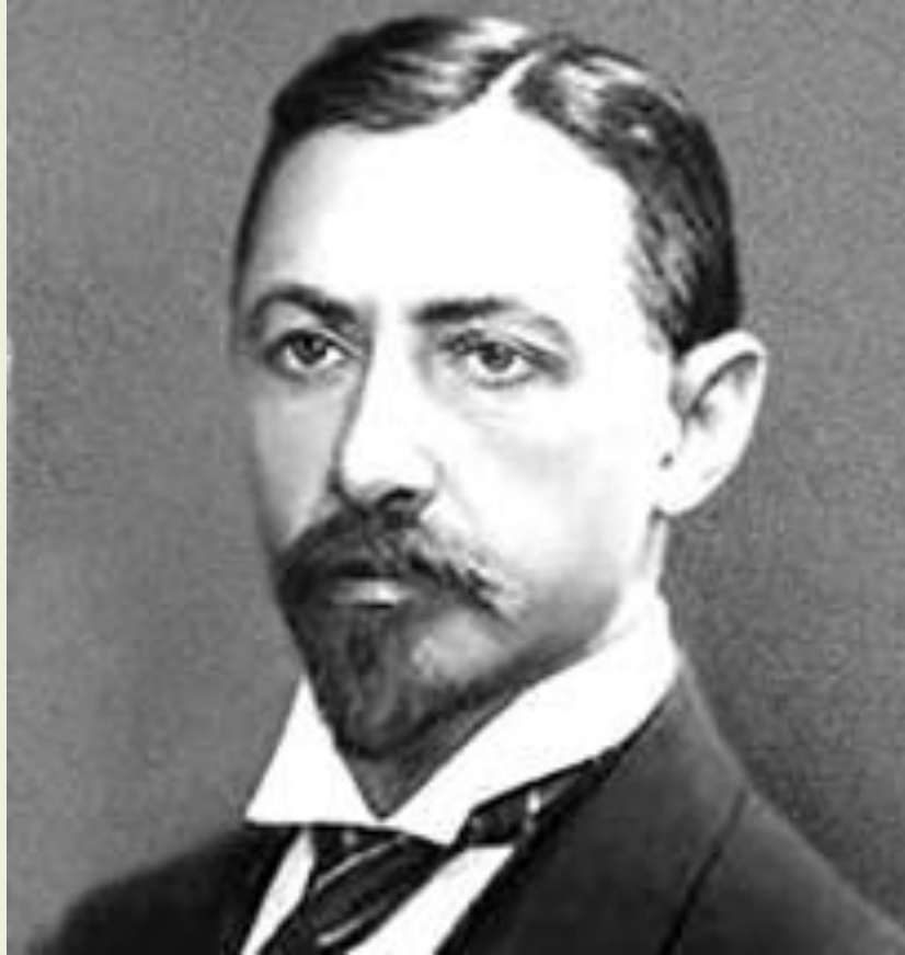
Бунин Иван Андреевич