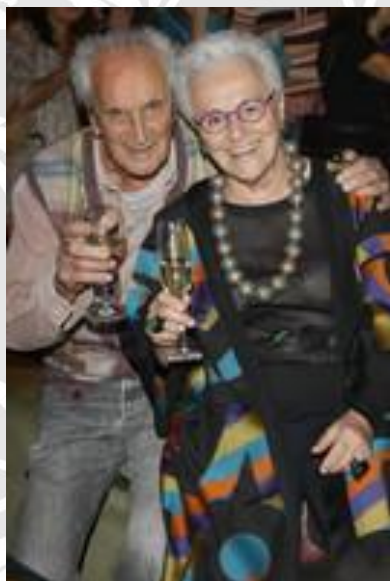
Оттавио и Розита Миссони

Событие это было отмечено огромным успехом и с тех пор многие известные дома моды отдают предпочтение трикотажу, как невероятно практичному, универсальному и благородному материалу.