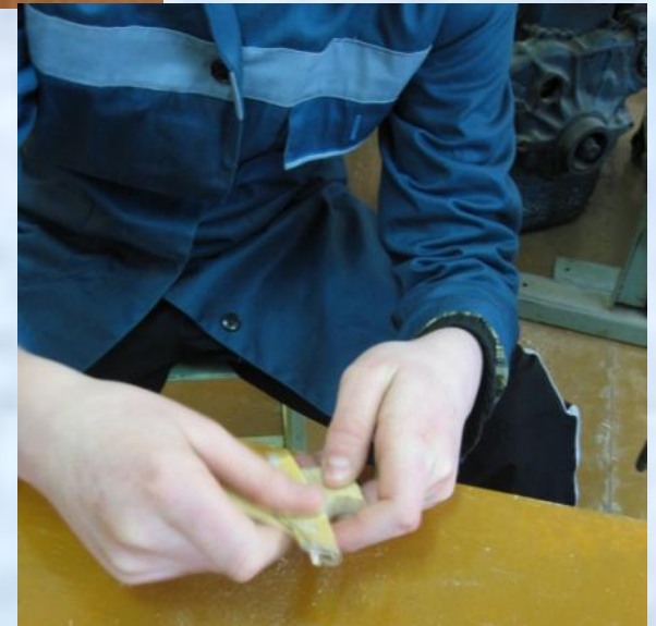
Окончательная зачистка деталей изделия