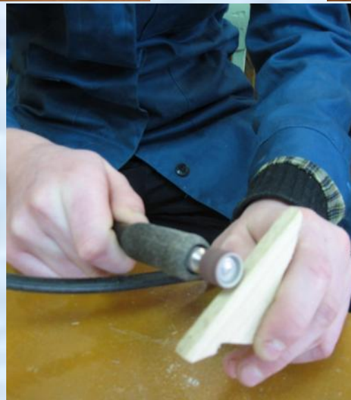
Правка и шлифовка поверхности деталей