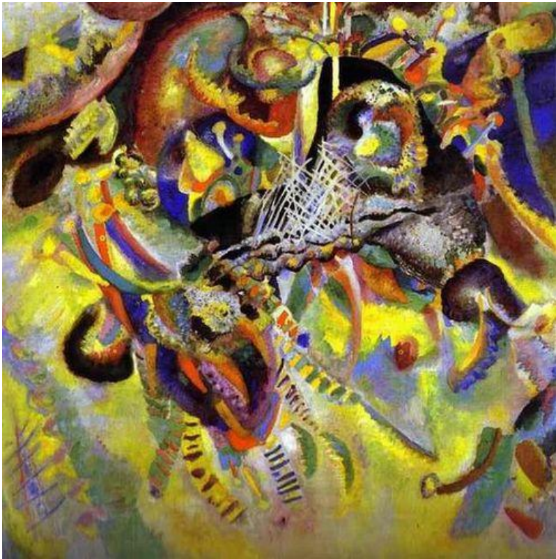
Кандинский «Апофеоз абстракции»