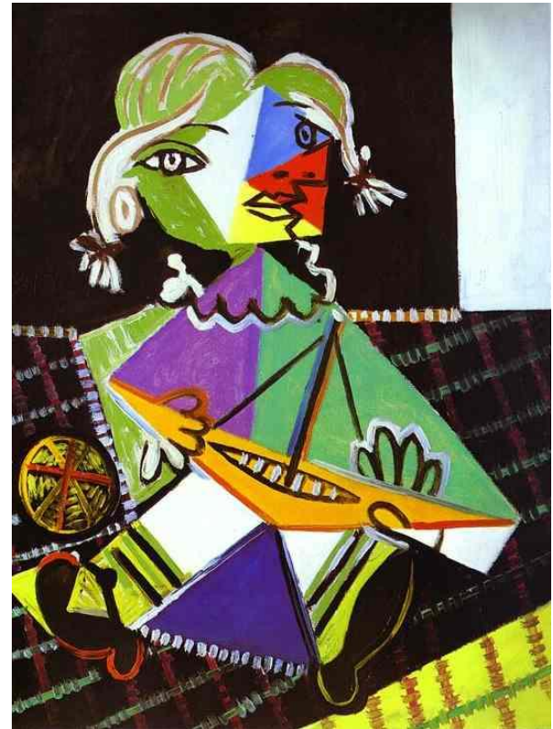
Пабло Пикассо «Девочка с лодочкой»