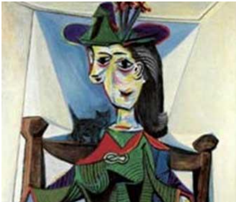
Пабло Пикассо «Дора Маар с кошкой»