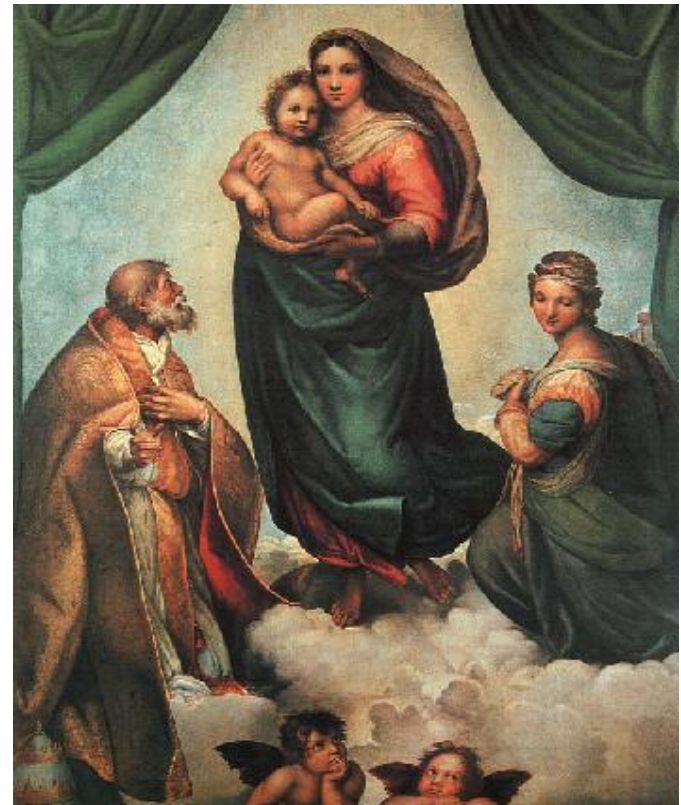
Рафаэль Санти «Сикстинская мадонна»