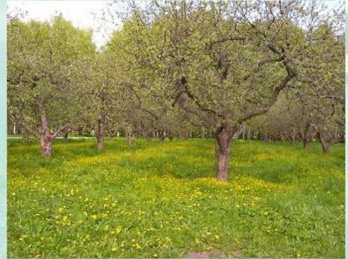
Яблоневый сад - агроэкосистема.

Агроценозы - сообщества, искусственно созданные человеком. К ним относятся парк, поле, пруд, сад и др. Агроэкосистемы - сельскохозяйственные экосистемы .