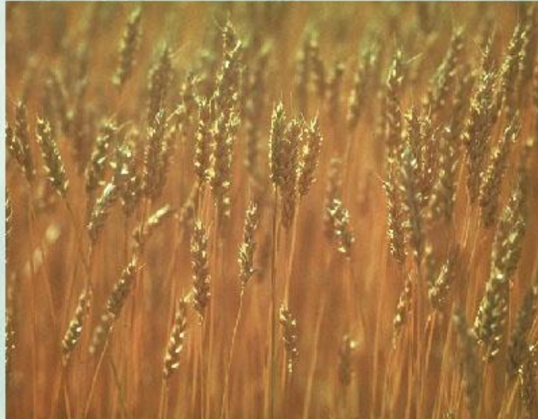
Агросистема - пшеничное поле.

Видовое разнообразие в агроэкосистемах значительно беднее, чем в биogeоценозах, так как в них обычно культивируется один или несколько видов растений. Например, пшеница на пшеничном поле, ягодные кустарники в саду. В связи с этим резко сокращается численность и разнообразие животных и микроорганизмов, жизнь которых тесно связана с жизнью растений. Сокращается и число звеньев в цепях питания.