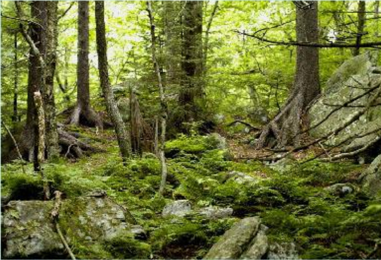
Лес - естественная экосистема.