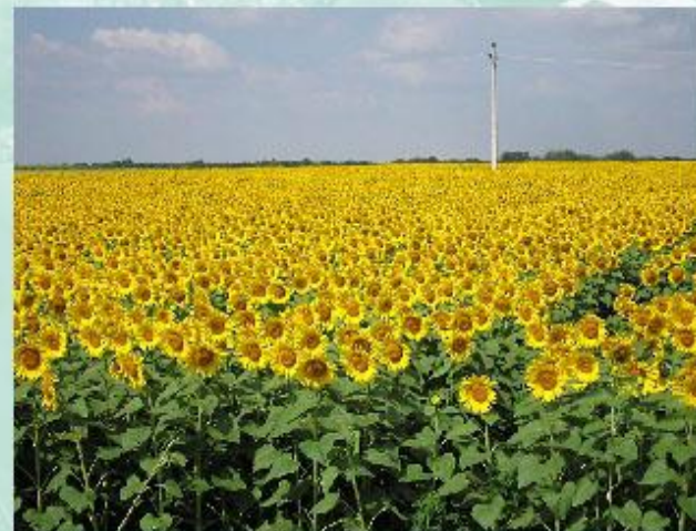
Поле подсолнечников - агроэкосистема.

Рассмотрим более детально особенности агроэкосистем.