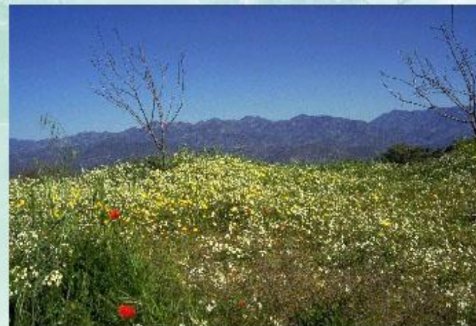
Альпийский луг - естественная экосистема.