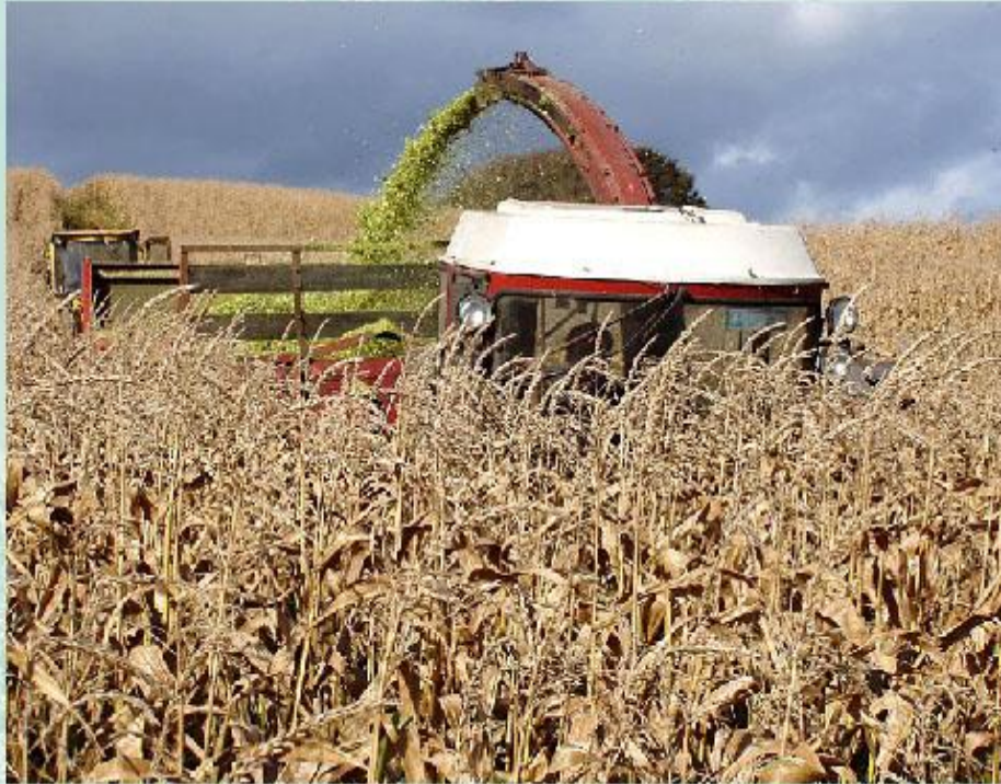
Уборка урожая маиса.

Ухудшаются условия существования редуцентов , так как биомасса корней культурных растений сосредоточена в основном в поверхностных слоях почвы и в 10 раз меньше, чем у диких трав. Надземные части растений увозятся с полей, что уменьшает поступление органических веществ в почву. Исчезает подстилка из опада - среда обитания редуцентов. Обработка почвы делает более доступными для хищников личинки организмов, обитающих в почве. Таким образом, ежегодные потери урожая обусловлены двумя факторами: разрушением процессов естественной регуляции численности видов в экосистемах; развитием устойчивости к ядохимикатам у насекомых - вредителей. Кроме того, надо помнить, что, накапливаясь в растениях, пестициды и ядохимикаты попадают в организм человека, что не благоприятно сказывается на его здоровье.