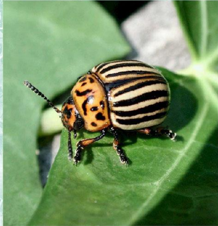
Колорадский жук - вредитель картофельных полей.

Эти изменения оказывают влияние на консументы в пищевой цепи. У некоторых видов растительноядных насекомых, выживших после обработки полей гербицидами, наблюдается массовое размножение. Этому способствует исчезновение большинства хищников и паразитов насекомых; питаются они посеянными растениями, и им не надо тратить энергию на поиск корма.