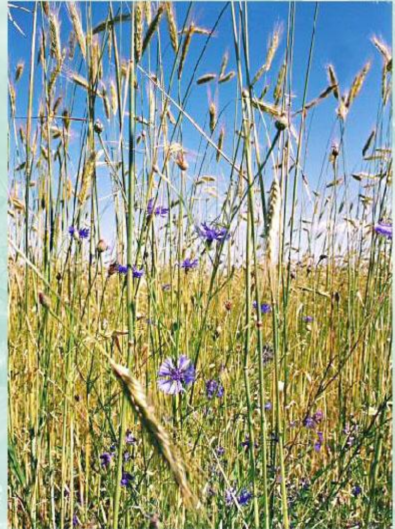
Яркий цветок василек - сорняк, произрастающий на пшеничном поле.

Прежде всего, наблюдаются изменения в пищевых цепях, основу которых составляют продуценты . Выращивание одного вида растений на полях приводит к массовому распространению сорняков и насекомых, питающихся культурными растениями. На целине сорняки в основном произрастают на выбросах почвы из нор сусликов и сурков, где содержится много азота. На полях благодаря деятельности человека создаются хорошие условия для распространения сорняков и вредителей. Для борьбы с ними используются гербициды и другие препараты. Вместе с сорняками и насекомыми-вредителями погибают и другие виды организмов.