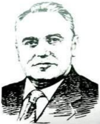
С. П. Королев