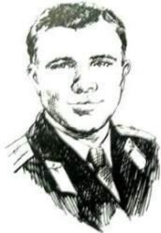
Ю. А. Гагарин

Самые большие достижения в области покорения космоса принадлежат нашей стране-России.