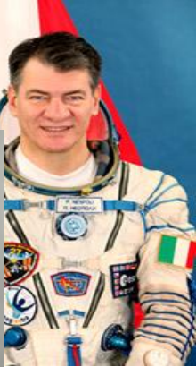
Паоло Анжело Несполи