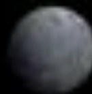
2007 OR 10