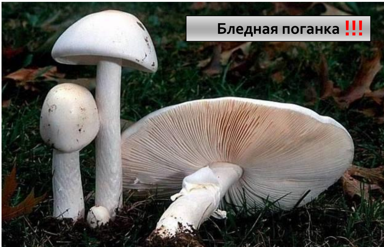
Бледная поганка !!!