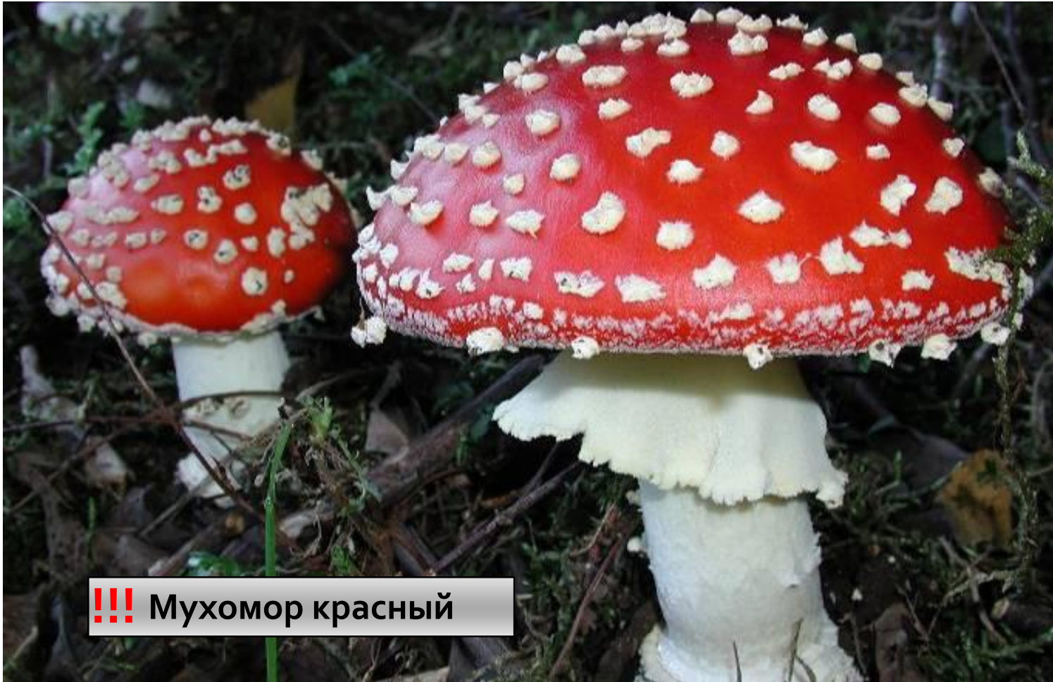
!!! Мухомор красный

Красивый, ярко окрашенный гриб. Встречается летом и осенью в лиственный и смешанных лесах.