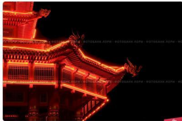
Элиста, Калмыкия, Фрагмент "Пагоды Семи Дней" с ночной подсветкой