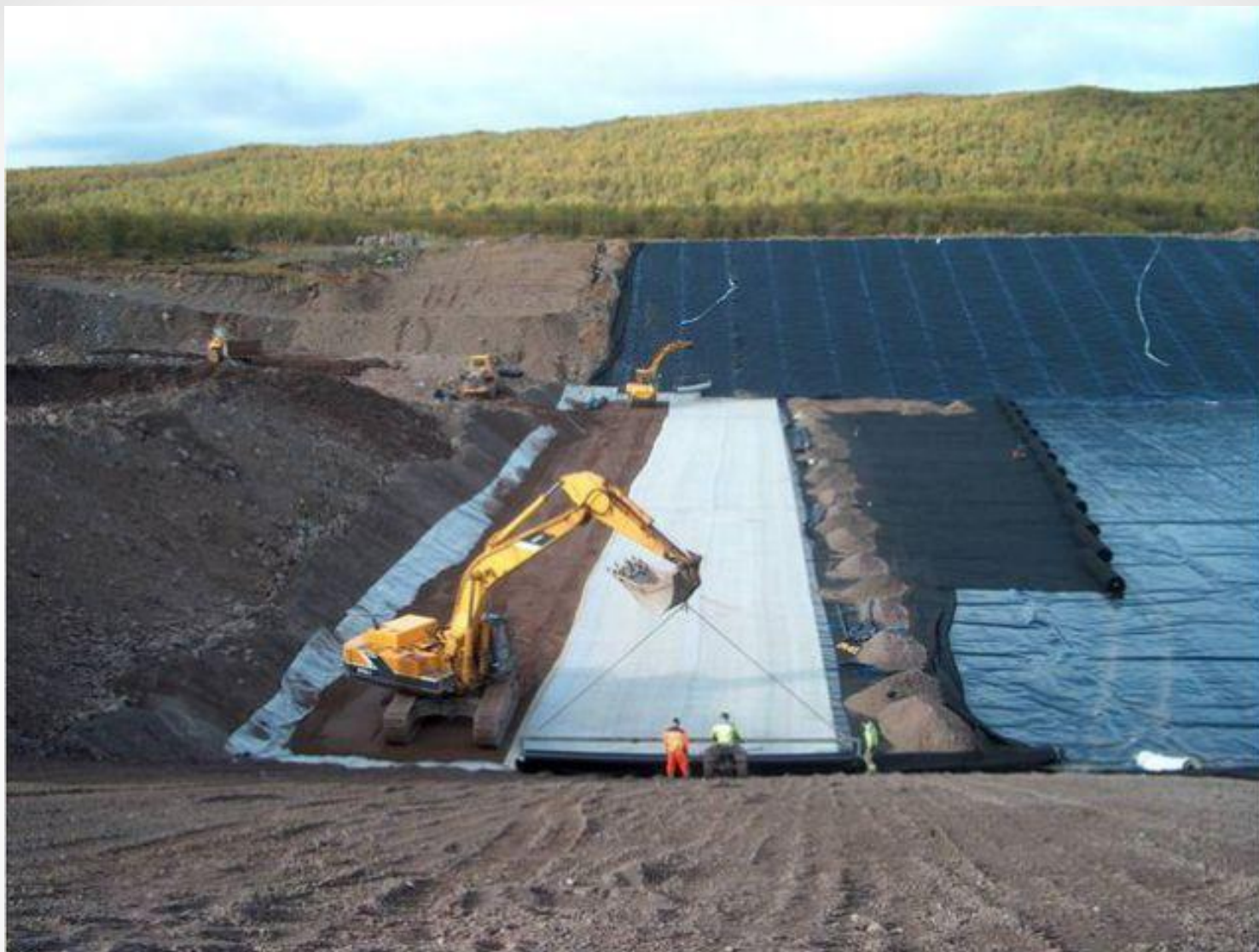
Полигон ТБО «МАГ-1», Нижегородская область. Он предназначен для размещения и обезвреживания твердых бытовых отходов (ТБО) и промышленных отходов (ПО) 3-4 классов опасности. Рассчитан на 15 лет эксплуатации.