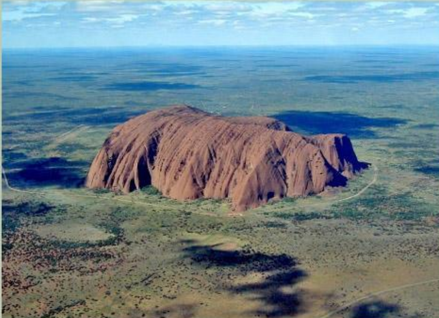
Скала Айерс-Рок (Улуру).

В центре Австралии находится Центральная равнина - самая низкая (от -12 м до 100 м) и плоская часть материка. В ее основе лежит прогиб земной коры, покрытый морскими и речными осадочными породами.